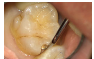
カーブによる 臼歯隣接面の軟化象牙質の除去 (C-O.7使用)