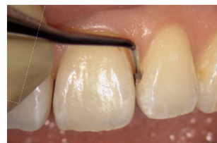
ストレートによる 前歯隣接面の軟化象牙質の除去 (S-O.7使用)