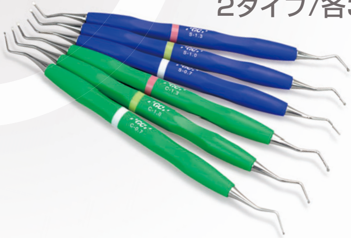
ストレート(把持部:青) カーブ(把持部:緑)