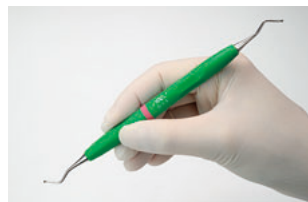
操作しやすい長さの把持部

※オートクレーブ滅菌可能ですが乾燥時には170℃以上にならないようにしてください。