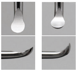
ストレート カーブ

ストレートとカーブの2種類の刃先により、届きにくい舌側面や遠心面などの軟化象牙質も容易に形成できます。