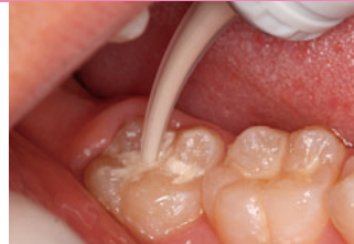
フジVIIカプセル(ホワイト)填塞