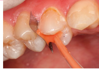
フジVIIカプセル(ピンク)填入