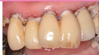
形態修正を行ない、ブラークコントロールしやすい環境に改善する