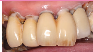
フジVII(ホワイト)充填