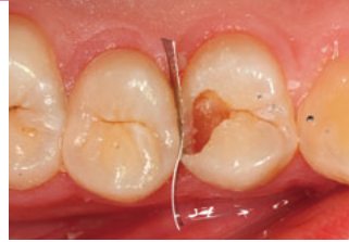
軟化象牙質の除去後、覆髄剤塗布