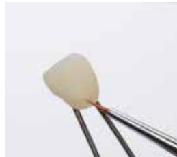
キャラクタライズ