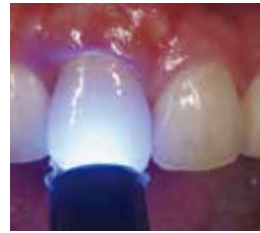
光照射 (40秒/G-ライトプリマII PLUS)