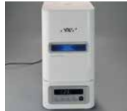
光重合 (90秒/ラボライトDUO)