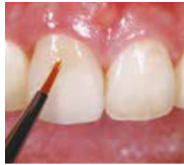
キャラクタライズ