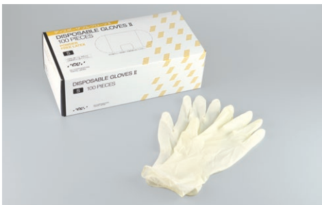
ディスポーザブル手袋(ラテックス製・未滅菌)