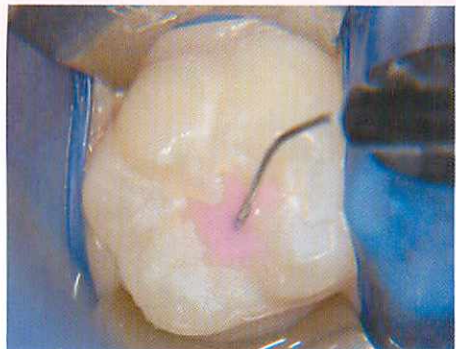
4.クリンプロ ™ シーラントを填塞