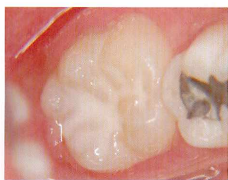
7.術後 (未重合層をふき取り、咬合チェック後)