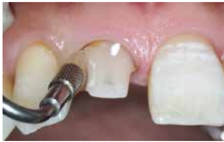
5 エアスケーラー(ソニックフレックス クリーンフォルダー48 及びフラット型ブラシ小:カボデンタルシステムズジャパン株式会社)を用いて確実に洗い流す。