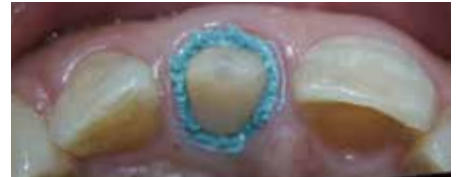
3 ペースト注入後、2～5分間静置する。