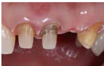
2 ペースト注入後、2～5分間静置してから水洗で洗浄除去し、エア乾燥する。正確な印象を採取し易い圧排処理が完了している。