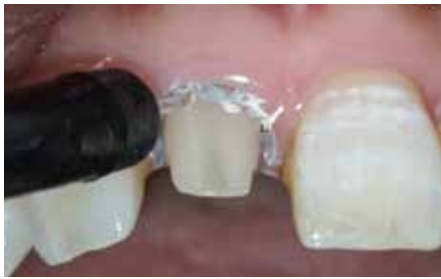
4 スリーウェイシリンジを用いてペーストを洗い流す。ペーストは水溶性のため水洗で除去できる。