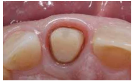
6 内縁上皮が外側に押し広げられ、歯肉縁下のフィニッシュラインが明瞭に確認できる。上皮付着の損傷は無く、出血や浸出液は認められない。