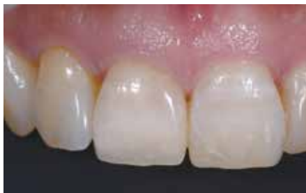
8 補綴物装着後。歯肉の退縮は見られない。