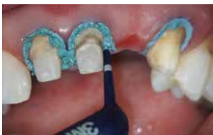
1 今回は、圧排系とペーストを併用して歯肉圧排する。支台歯形成後圧排系にて一次圧排し、その上から3M™ ESPE™ 圧排ペーストを注入する。