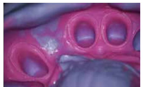
3 インプリント™ 4 印象材 ソフトトレー ボディとライト ボディにて印象を採得した。

販売名：3M ESPE 圧排ペースト 届出番号：13B1X10109000253 販売名：レストラティブ ディスペンサー 届出番号：13B1X10109000161 販売名：インプリント 4 印象材 認証番号：225AKBZX00168000 価格は、すべて税抜き本体価格です。掲載の情報は、2015年6月現在のものです。 3M、ESPE、インプリントは、3M社またはその関連会社の商標です。