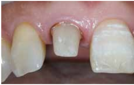
1 支台歯形成後、印象採得を確実にするための歯肉圧排を行う。