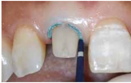
2 3M™ ESPE™ 圧排ペーストで歯肉圧排する。先端を歯肉溝に挿入し、広げるようにゆっくりとペーストを注入していく。