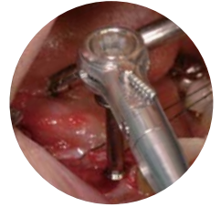
置き針式ゲージ: 埋入時の最高トルクを記録します。