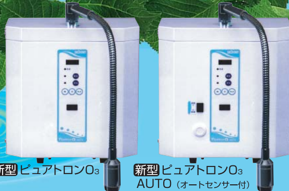
新型ピュアトロン O_3