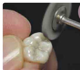
ノリタケプロテック ダイヤモンドポイントSC-51