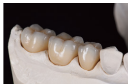
2. 陶材®の築盛・焼成 ※セラビアン®ZR