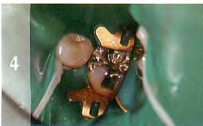
4 フェンダーメイトを抜き取って余剰分を形成します