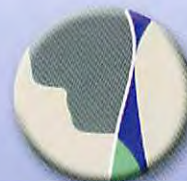
適切に余剰なく歯頸部に充填