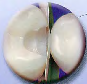
余剰無く歯頸部を充填