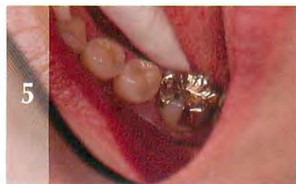
5 良好な修復状態が続いている