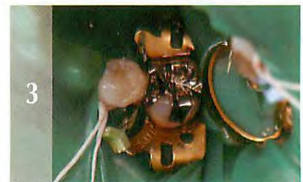
3 充填し、圧接形成します