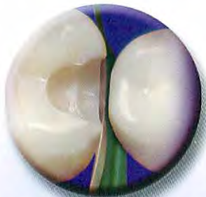
歯間に合わせてあらかじめ曲げてあるフェンダーメイトを差し込む