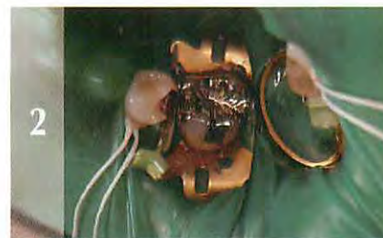
2 歯間を広げながらフェンダーメイトを差し込みます