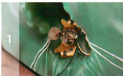
1 フェンダーウェッジ・プロを使用し形成を完了