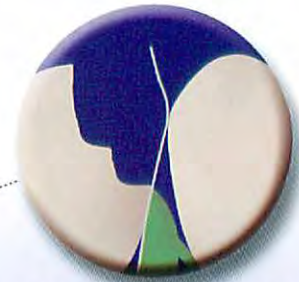
自然なコンタクトポイントを形成