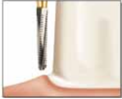
シャンファー / FIG No.856