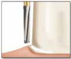
ショルダー / FIG No.847