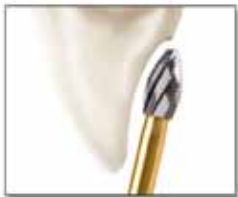
舌側・咬合面 / FIG No.379