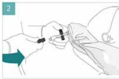
2 パルプを開いて、バキュームと接続し吸引しながら形と硬さを調節します