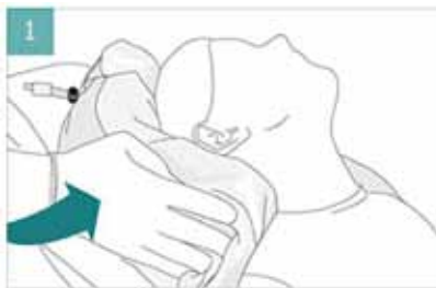
1 本商品を頭部の下に置き、図のように手を添えて形を作ります