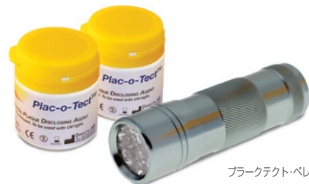
ブラークテクト・ペレット イエロー LEDキット

商品名 ブラークテクト・ペレット ブルー ● 標準価格 1,900円(税別)/100個入