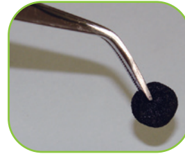
ブラークテクト・ペレットブルー

標準価格 3,200 円 (税別) 医療機器届出番号 13B1X00133000037