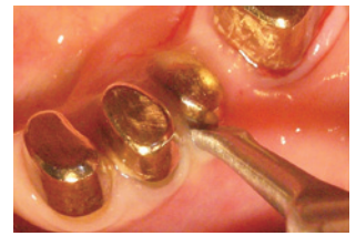
歯牙長軸方向にペリオカットを保持