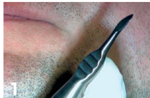
1 安全のため、人差し指をストッパーに置き、抜歯処置を行う