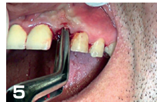
5 ほとんどの症例で歯周靭帯が切断され歯牙が脱臼する