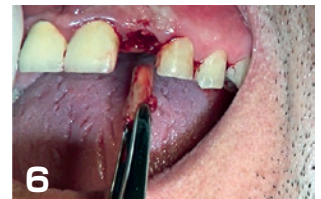
6 適切な鉗子で歯牙の摘出

注意：間違った使用方法によるブレードの破損や折れは保証の対象になりません *本製品は鋭い刃を持っていますので取扱にはご注意ください