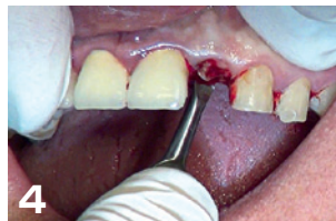
4 ペリオカットを口蓋側に挿入し同様の処置を行う