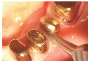
歯周ポケットに挿入し、歯周靭帯切断