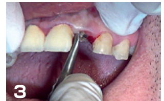
3 近心側も同様の処置を行う