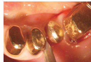
歯牙に沿わせて歯周靭帯を切り進める