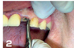
2 ペリオカットを遠心側の歯根膜腔およそ 5mm まで挿入