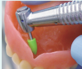
RA コース 0608 を用いて内面を調整 ヘッドが小さいため細部まで届きやすい