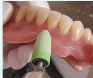
HPコース 6720 で荒研磨 小帯部に届きやすい形状