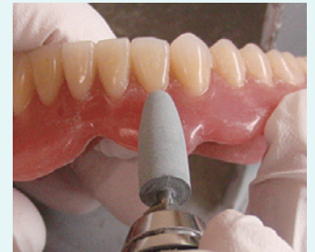
HPファイン 6820 で仕上げ研磨 ヘッドは取り回しが良いサイズで歯間乳頭も磨きやすい