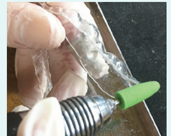
HP コース 6720 でマウスピースのバリ取りに