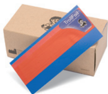
レッド 100 枚 / 箱