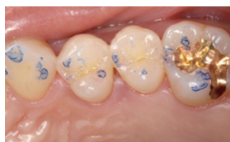
トロール咬合紙 (赤: 中心咬合位 青: 側方運動) による天然歯の咬合印記状態