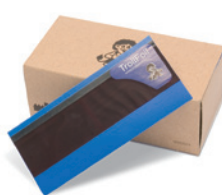
ブルー 100 枚 / 箱