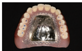
トロール咬合紙 (赤: 中心咬合位 青: 側方運動) による上顎義歯の咬合印記状態