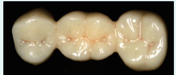
4: KENDA ジルコビスを用いてジルコニアクラウン研磨後