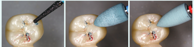
1. プレデタージルコニアを使用し、ジルコニアクラウン(Z冠)の咬合調整を行う 2・3. 咬合調整後、KENDA ジルコビス (0258 ミディアム・0268 ファイン) を使用し研磨を行う