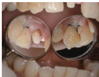
*クロスフィールド® 鏡 取扱いのミラーによる比較