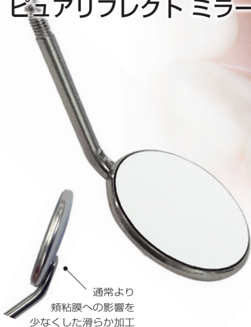
通常より 頬粘膜への影響を 少なくした滑らか加工