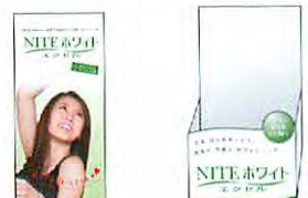
NWE 患者用小冊子 (V2010) 20枚入 NWE 患者用小冊子 (V2010) スタンドセット