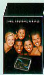
患者用小冊子スタンド