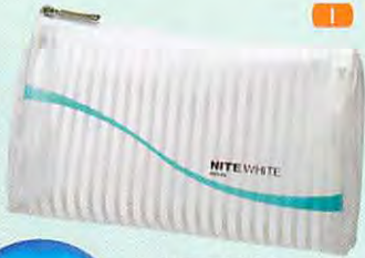
NITE ホワイト ポーチ