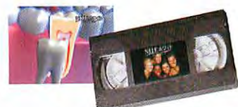
患者向プレゼンテーション用ビデオ