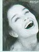
ポスター (モノクローム3枚入り)

※NITEホワイト・エクセル ジェルの有効期間は米国にて製造時から2年間となります。