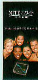
患者用小冊子 (20枚入り)