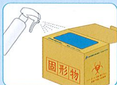
感染性医療廃棄箱へ直接 除菌