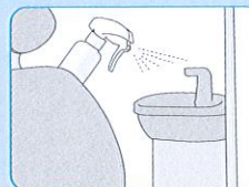
スピットンの除菌

①衣類やその他繊維製品へのご使用は、繊維の種類によっては若干漂白作用がありますので目立たない場所で試すなど注意してご使用ください。