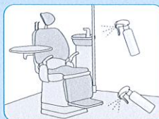
診察室の床や機器類の除菌