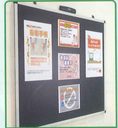
医院の総合案内として