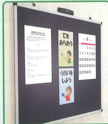
スタッフルームの掲示板として