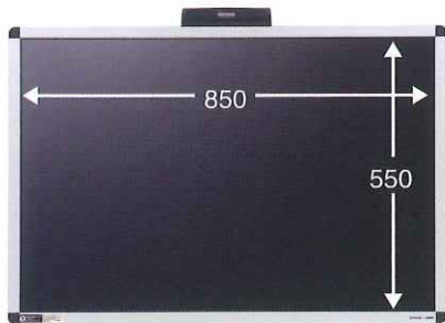
RK9060 <本体価格> ¥10,000 + 消費税