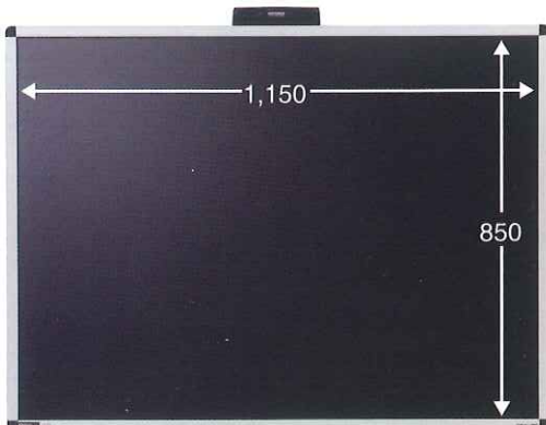
RK12090 <本体価格> ¥20,000 + 消費税