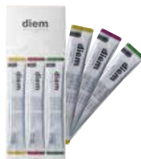
ボタニカル マウスウォッシュスティック

限定フレーバー ライムベルガモットアロマ・ミント ジンジャーアロマ・ミント ローズアロマ・ミント