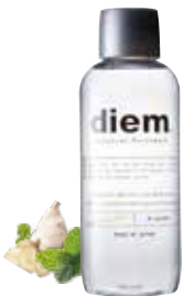
ボタニカル マウスウォッシュ