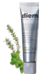
ボタニカル トゥースペースト