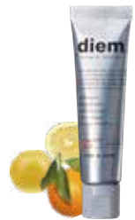
ボタニカル トゥースジェル