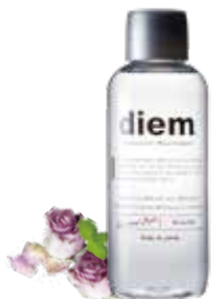
ボタニカル マウスウォッシュ