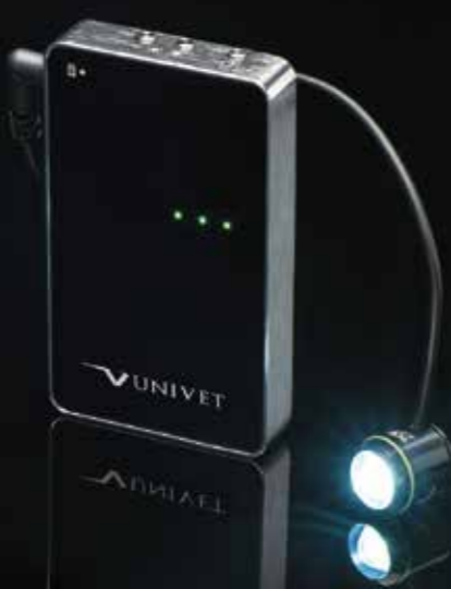
ユニバット LEDイルミネーションシステムEOS 2.0 ¥126,000

必要に応じて光量を3段階で変更可能なLEDライトを使用したイルミネーションシステム。 広いスポット径で拡大視野(=術野)を照射します。