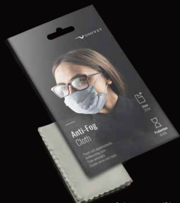
ユニバット アンチフォグクロス ¥1,800