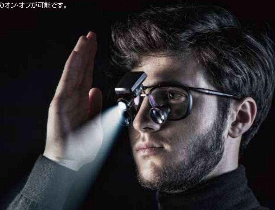
ユニバット LED イルミネーションシステム EOS ワイヤレス ¥210,000

ケーブルがまったくなく、LEDライトとバッテリーを組み合わせた軽量ボディ。 この新しいイルミネーションシステムには、高度なハンドジェスチャ認識テクノロジーが搭載されており、触れることなくライトのオン・オフが可能です。