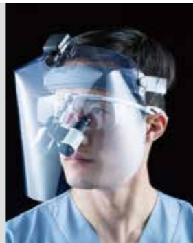
ユニバット双眼ルーペ プリズマティック FLIP-UP + ユニバット LED イルミネーションシステム EOS ワイヤレス

注意 ❖ユニバット 双眼ルーペ プリズマティックヘッドバンドとは併用できません。 ❖本製品は、飛沫飛散の拡散を軽減するものであり、完全に防止するものではありません。