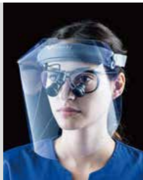
ユニバット双眼ルーペ ガリレアン TTL + ユニバット LED イルミネーションシステム EOS2.0