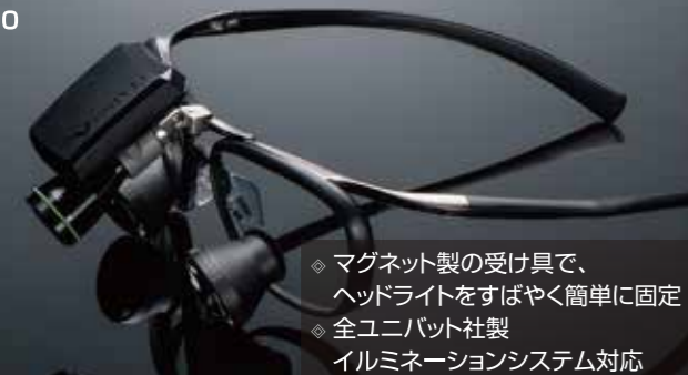
ユニバット EOS用 マグネットマウント ¥13,000

◆ マグネット製の受け具で、 ヘッドライトをすばやく簡単に固定 ◆ 全ユニバット社製 イルミネーションシステム対応