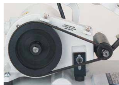
スピンドルの作業高さの変更が可能