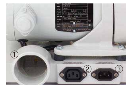
①集塵ポート [内径 58mm 外径 67mm] ②ダストコレクター接続ポート ③電源コード接続部 (出力)

強力なトルクと耐久性に優れたグラインダー。スピンドルはオートマチックで耐久性に優れ、ハンドピースの交換はレバー1本で簡単。 ● スピードコントロールにより、0~26,000rpmまで変速可能 ● 粗研磨から仕上げ研磨対応 ● 本機裏の吸引口に集塵機を接続し、作業中の粉塵の飛散を防止 電 源：100V, 50/60Hz 回転速度：0~26,000 rpm ※変速可能 消費電力：230W/26,000rpm時 出 力：1/3HP 寸 法：W280 x D340 x H250(mm) 重 量：15kg 価 格：¥450,000/台