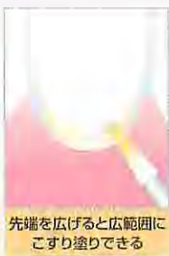
歯肉線下や歯間部にアクセスしやすい