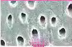
象牙細管が開いた象牙質表面