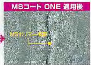
MSポリマー被膜でマイクロクラックを封鎖し、刺激の伝達を抑制する。