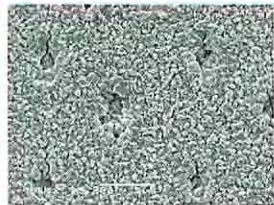
シュウ酸カルシウム結晶を含んだMSポリマー被膜が象牙細管を封鎖している。