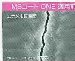
ホワイトニング後のマイクロクラックは刺激を伝達しやすくなる。

ホワイトニング前の知覚過敏予防、ホワイトニング後の知覚過敏抑制にも高い効果が期待できます。