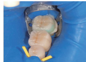
接着性レジンセメントでセットし、 余剰レジン除去