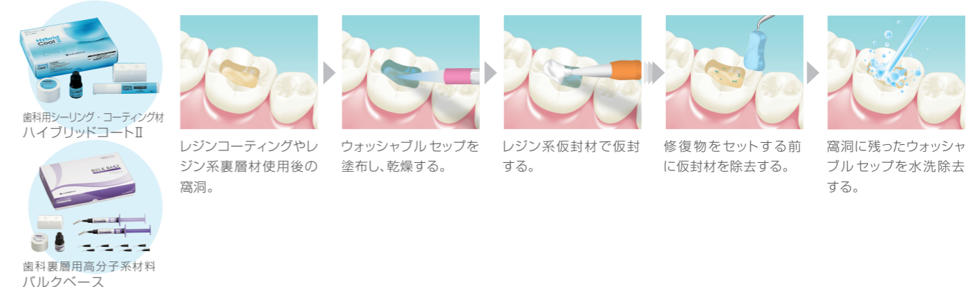
歯科用シーリング・コーティング材ハイブリッドコートII レジンコーティングやレジン系裏層材使用後の窩洞。 ウォッシュャブルセップを塗布し、乾燥する。 レジン系仮封材で仮封する。 修復物をセットする前に仮封材を除去する。 窩洞に残ったウォッシュャブルセップを水洗除去する。