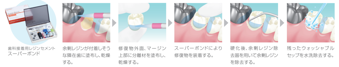
歯科接着用レジンセメントスーパーボンド 余剰レジンが付着しそうな隣在歯に塗布し、乾燥する。 修復物外面、マージン上部に分離材を塗布し、乾燥する。 スーパーボンドにより修復物を装着する。 硬化後、余剰レジン除去器を用いて余剰レジンを除去する。 残ったウォッシュャブルセップを水洗除去する。