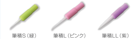
筆積S (緑) 筆積L (ピンク) 筆積LL (紫)