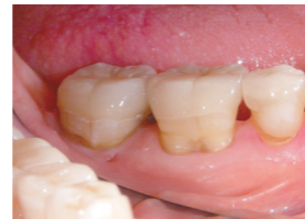
ウォッシュャブル セットを水で除去