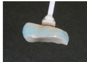
ウォッシュャブル セット塗布