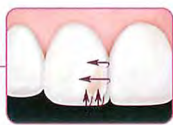
エナメルシェード 天然歯のエナメル質のような半透明性を有しています。