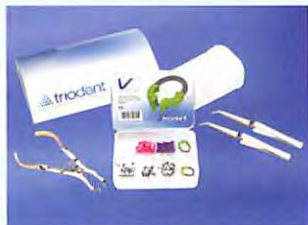
歯科用充填・修復材補助器具 V3 システム