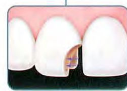
オペクシェード 最適な不透過性のベースを作ります。