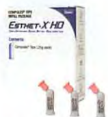
医療機器登録番号: 221AFBZX00052000