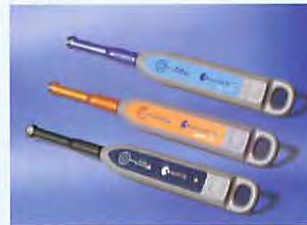
歯科用重合用光照射器 スマートライトPS、サンセット、スカイ