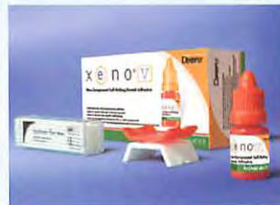
象牙質接着剤 クシーノ V