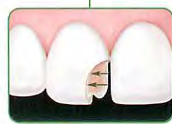
ボディシェード 周囲の象牙質とよくなじむ「カメレオン効果」をもっています。