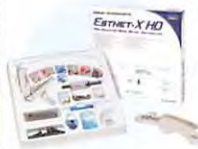
エステエックス HD イントロキット