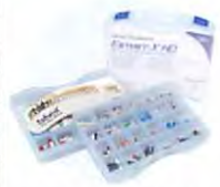
エステエックス HD コンプリートキット