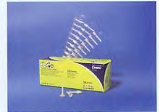
歯科用ゴム製研磨剤 PoGo (ポリッシュ&ゴー)