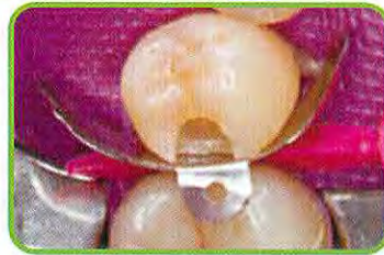
2. ピンツィーザーでタブマトリックスを把持し、セット後ウェーブウェッジを挿入