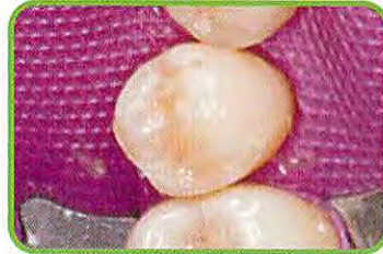
6. CRを重合させた後、V3リング、ウェーブウェッジ、タブマトリックスを撤去