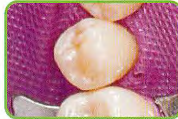
7. 形態修正、および研磨