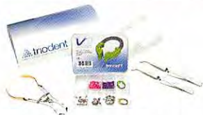
V3リング スターターパック