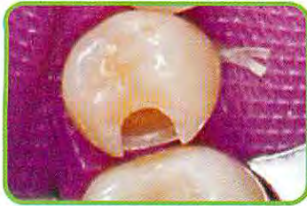
1. 通法に従って窩洞形成