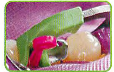
4. タブマトリックスと、ウェーブウェッジをV3リングで固定