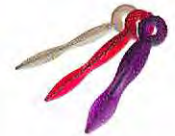
ウェーブウェッジ 白：スモール 赤：ミディアム 紫：ラージ