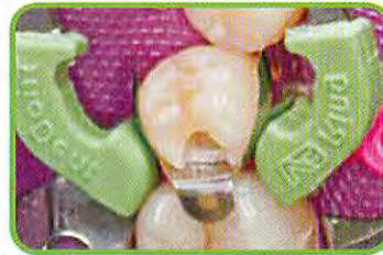
3. フォーセプスでV3リングを把持し、セット