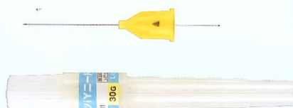
デンツプライニードル 30Gロング