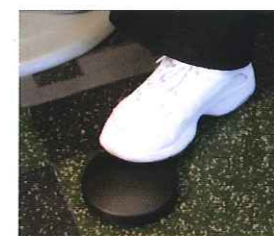
スピードコントロールも自由自在