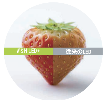
LEDとの比較: LED+では赤い色調を自然に再現可能

赤い色調の再現がうまくできませんでした。これは多くの医療用途で大きなデメリットとなっていました。しかし、アレグラコントラアングルは新しい技術を採用しています。その結果、CRIが90以上となり、クリアな色のコントラストを実現し、口腔内の自然な赤い色調を的確に再現します。