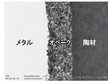
ビタVMKマスターのオパーク層のSEM写真

こうした2層にはさまれたビタ VMK マスターのとても均質なオパーク層が見られます。個々のオパークの成分が均一に配分されていることがはっきりとわかります。