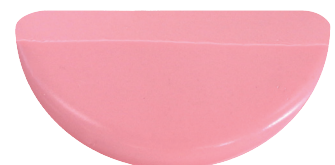
■ミクロナミキサーⅡ使用

ミクロナミキサーⅡで練和すると 気泡が入らず、印象材の性能を 100% 発揮することができます。