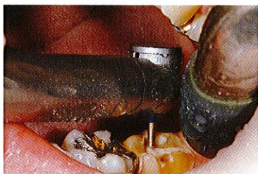
使用バー：EX-SS33 症例：下顎左側第二大臼歯のアンレー形成 歯冠長が短く、開口量も少ないケースに有効なバー。オールセラミックスなど丸みを帯びた形成が不可欠な修復材でのインレーやアンレー形成に適している。コーナーが丸みを帯びているため、窩底部に近い壁面がアンダーカットになりにくい。

臼歯部クラウンの軸面及びマージン形成全般に使用できるバーである。開口量の少ないケースに有効であり、対合歯の影響を受けにくく、歯軸に対して垂直にバーを使用している。遠心面、舌側面形成でもバーを滑らかに運びやすい。