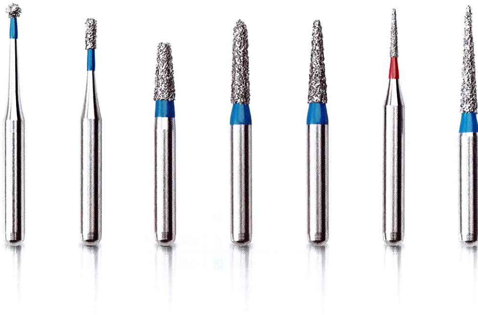
Short shank lineup

ショートシャंकならではの高いアクセス性を確保 治療をよりスムーズにするダイヤモンド