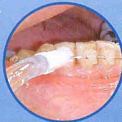
歯列矯正用チップ