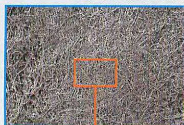
術前 プラークバイオフィルム

8歯の薄切標本に対し3秒間処置し、SEMで観察をおこなった結果、ジェットチップでは、バイオフィルムの99.9%が除去され、歯列矯正用チップでは99.8%が除去された。歯列矯正用チップでは、肉眼的にも、SEMでの観察においても、4歯の表面から石灰化されたバイオフィルムが顕著に除去されていた。