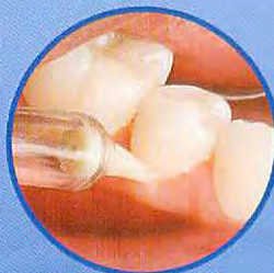
ピックポケットチップ