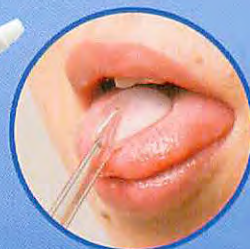
タンゲクリーナー

口臭予防用の舌クリーナー。 水圧調整ダイヤルを最小設定にし、 徐々に水圧を上げ、奥から手前へ向けて洗浄します。