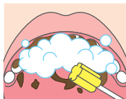
泡状の本剤を塗布