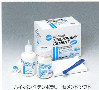
ハイボンド テンポラリーセメント ソフト