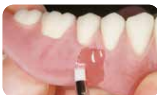
ユニブラシ No.4 使用

表面滑沢硬化材や広範囲へのオパーク塗布など広い面への塗布には「Lタイプ」の使用が効果的です。