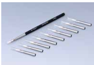
写真はSタイプです。