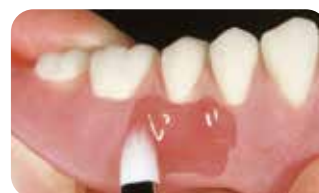
ユニブラシ オーバルタイプ「L」使用

■ 使用材料：レジングレース リキッドタイプ [ 歯科レジン系補綴物表面滑沢硬化材 ]