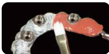
オーバルタイプ「L」使用 セラマージュ デュオ オパーク GUM-O を広範囲に塗布。