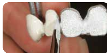
オーバルタイプ「S」使用 ソリデックス ハーデュラ オパーク を塗布。筆の側面を使用することで隣接部などの細部にも対応できます。