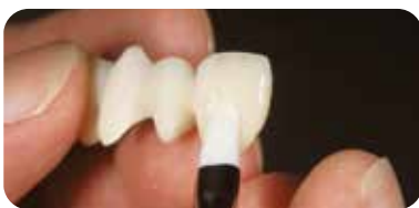
オーバルタイプ「L」使用 表面滑沢硬化材「レジングレース」を広範囲に塗布。