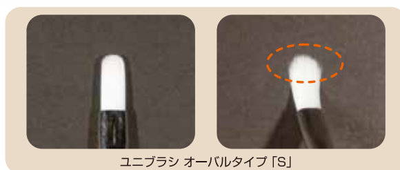
ユニブラシ オーバルタイプ「S」