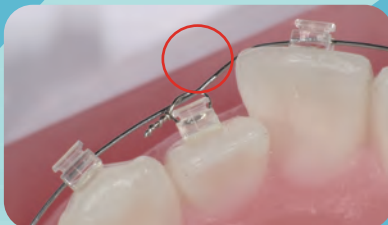
リガチャーワイヤーで牽引