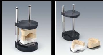
上下顎模型を正しく咬合させ、その位置でプレートに模型を固定し、装置にセットします。

上下顎模型を同時にセットすることができます。そのため対合歯をスキャンするための、模型の入れ替えが不要です。