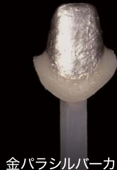
金パラシルバーカラー NEW