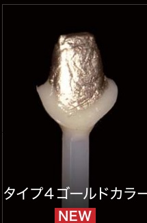
タイプ4ゴールドカラー NEW

ダイカラーワックスに ナイスフィット(新色) を塗布することで、メタルコアも表現できます。