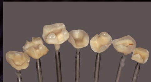
インレー窩洞の製作例