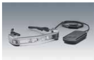
エプソン製 スマートグラス MOVERIO BT-350

*1:体感サイズには個人差があります。*2:Google Play非対応。*3:適合プラグ使用時も動作の一部に制限が発生することがあります。*4:リチウム含有量1.5g以下。ワット時定格量20Wh以下。*5:エプソン社評価条件における目安です。*6:メガネの形状によっては装着できないことがあります。幅が147mmを超えるメガネをお使いの方は装着できません。