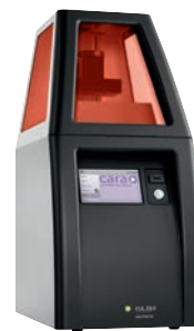
カーラ プリント 4.0

歯科咬合スプリント製作用の造形用インクです。 専用の3Dプリンター「カーラ プリント 4.0」で 造形することが可能です。