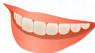
タバコのヤニなどの着色汚れ