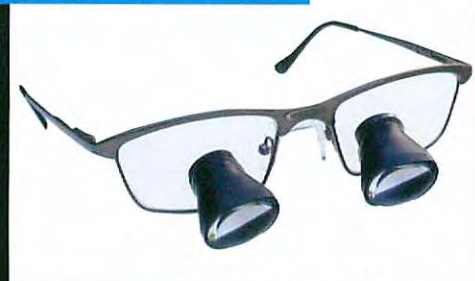
ヴィクトリーフレーム