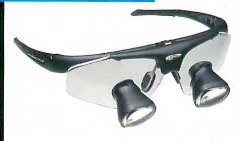
レボリューション