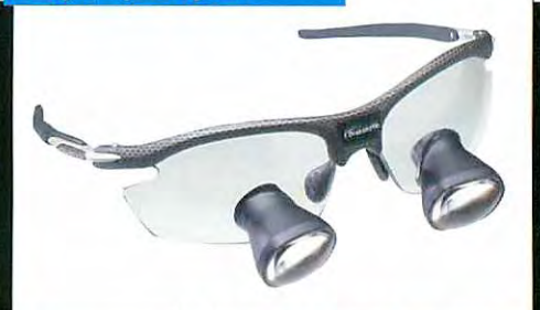
ルディー・プロジェクト・ライドン