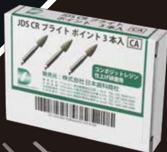
JDS CRブライツ ポイント 包装:3本 価格 1,800円