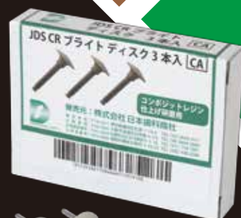
JDS CRブライツ ディスク 包装:3本 価格 2,300円