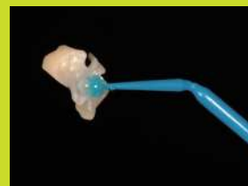
インレーの保持に