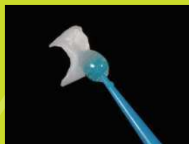
インレーの保持に