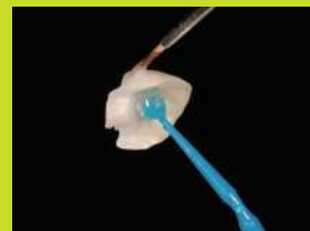
補綴物のステイニングに