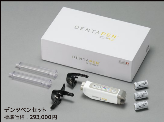
デンタペンセット 標準価格：293,000円