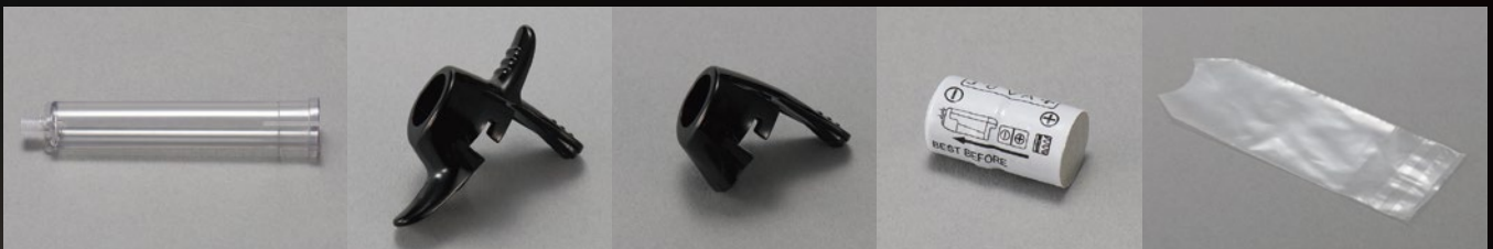
カートリッジホルダー 5本入 標準価格：10,500円