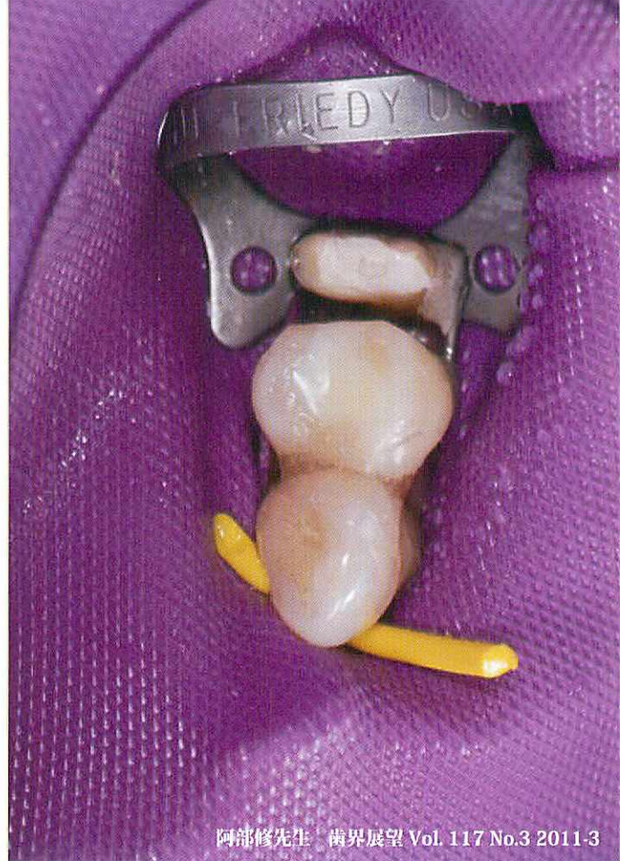
阿部修先生 歯界展望 Vol. 117 No.3 2011-3