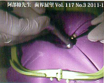
阿部修先生 歯界展望 Vol. 117 No.3 2011-1